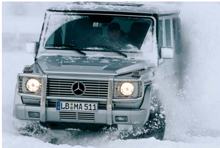
Die AMG-Fahrzeuge garantieren Mobilität im Schnee

Mercedes-AMG GmbH – das 1967 gegründete Unternehmen ist die High Performance Marke von Mercedes-Benz. AMG steht für Dynamik, Individualität und Souveränität gepaart mit technischer Innovation. Das einzigartige Modellprogramm besteht aktuell aus 16 AMG Hochleistungsautomobilen. Geboren auf der Rennstrecke, präsentiert AMG in der DTM Jahr für Jahr spannenden Motorsport auf höchstem Niveau. Mercedes-AMG