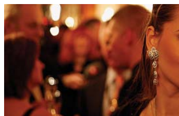
Glamour an der Galanight .... 2