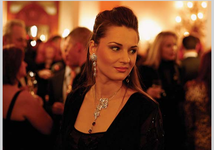
Schöne Kleider und viel Glamour an der Polo-Galanight am Samstagabend im Badrutts Palace Hotel