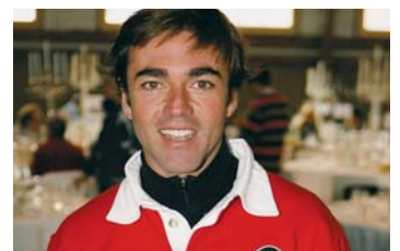
Interview José Donoso