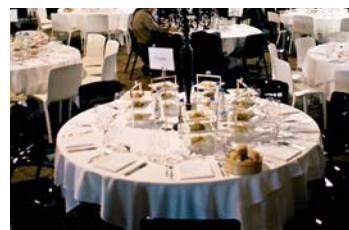
VIPs an neuem Ort