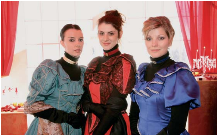
Botschafterinnen des Palisades Projektes

Mit orientalischem Charme debütieren die Botschafter der Architekturvision «The Palisades» auf dem St. Moritzer See.